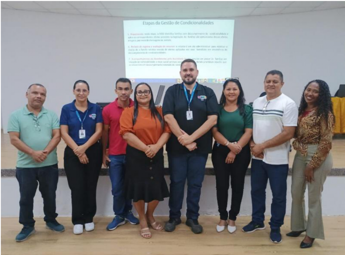
CAPACITAÇÃO CADASTRO ÚNICO/BOLSA FAMÍLIA