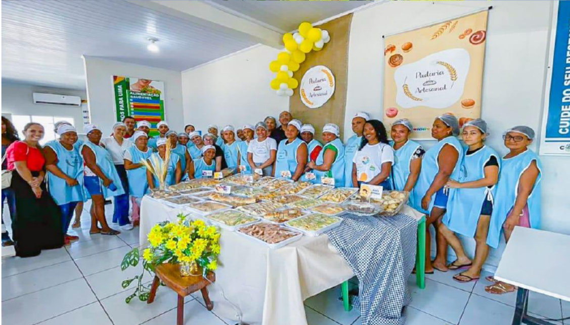
CURSO DE PADARIA ARTESANAL PARA USUÁRIOS DO CRAS, CRIANÇA FELIZ E PAA.