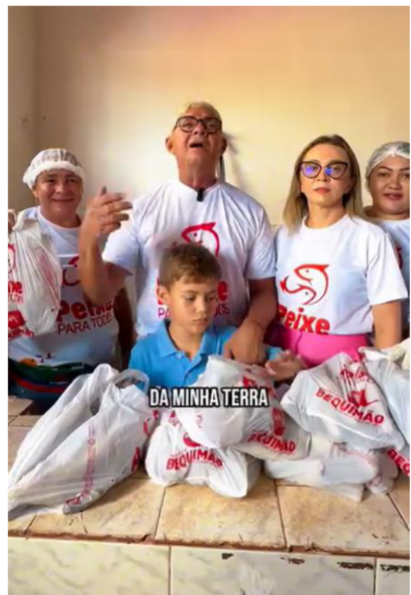
PROGRAMA PEIXE PARA TODOS