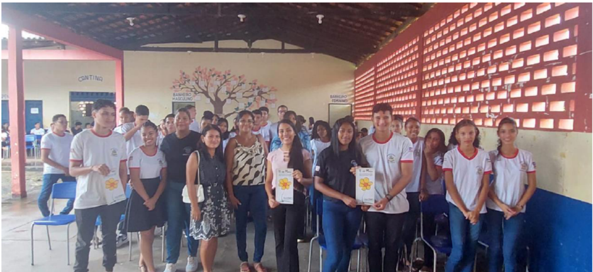
SEMAS/CAMPANHA FAÇA BONITA