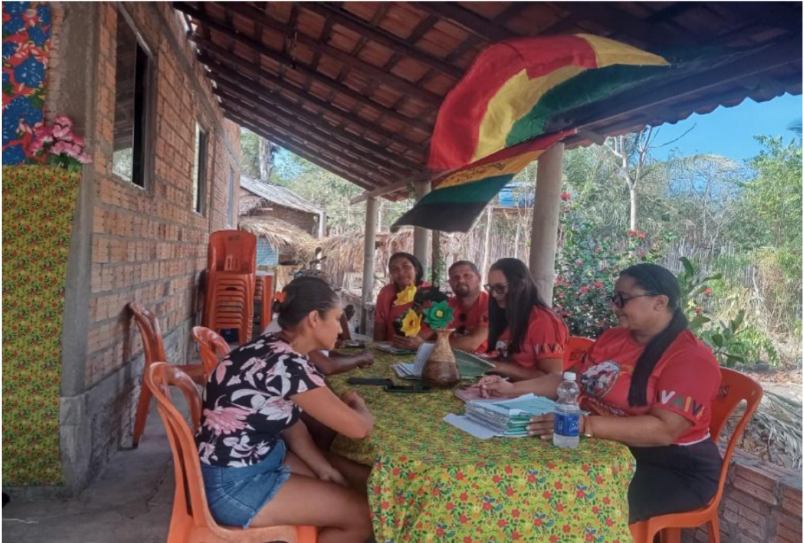
SEMANA DO BEBÊ QUILOMBOLA