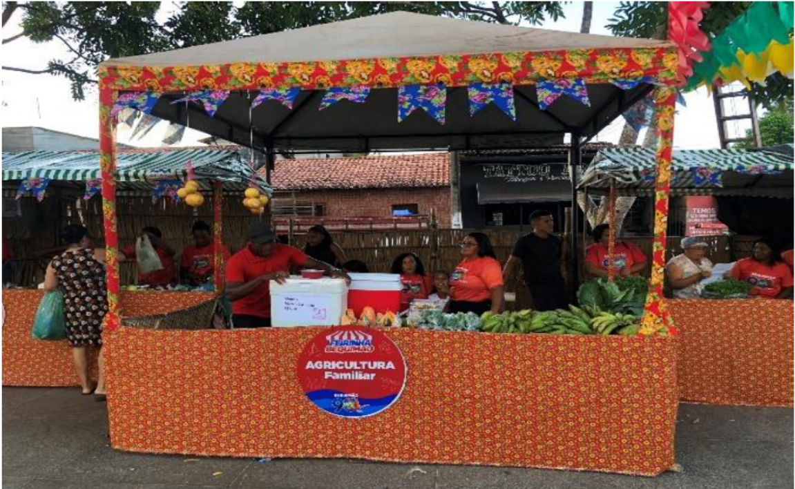
FEIRA DA AGRICULTURA FAMILIAR