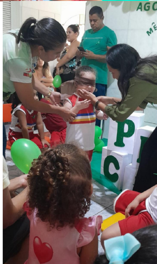
CRANÇA FELIZ – CAMPANHA AGOSTO VERDE