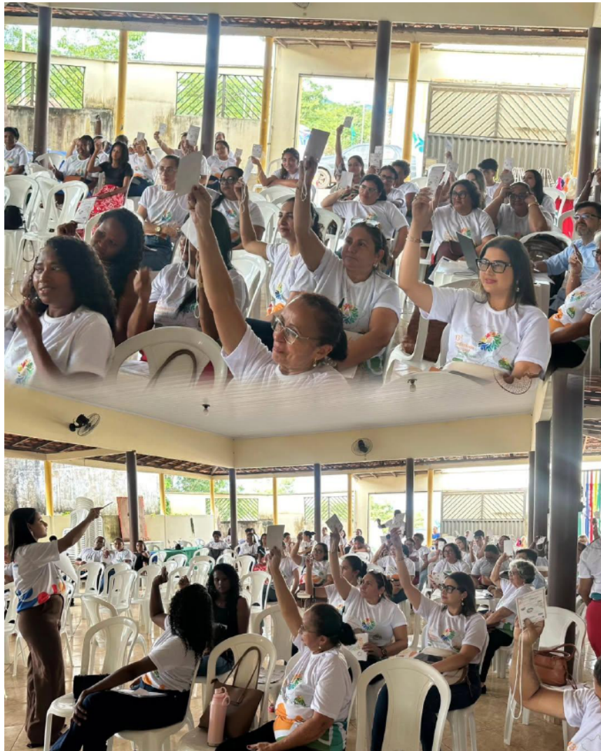
CONFEÊNCIA MUNICIPAL DA ASSISTÊNCIA SOCIAL