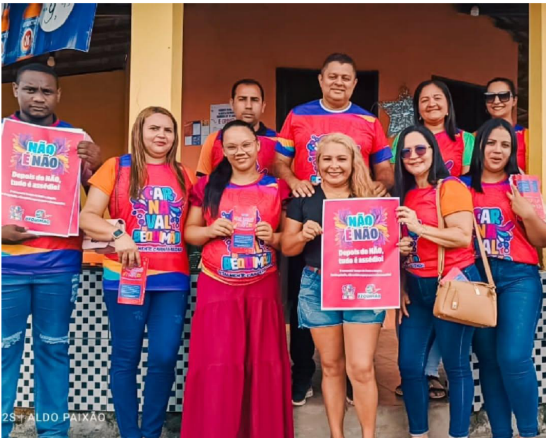
CAMPANHA CARNAVAL PULE, BRINQUE E CUIDE