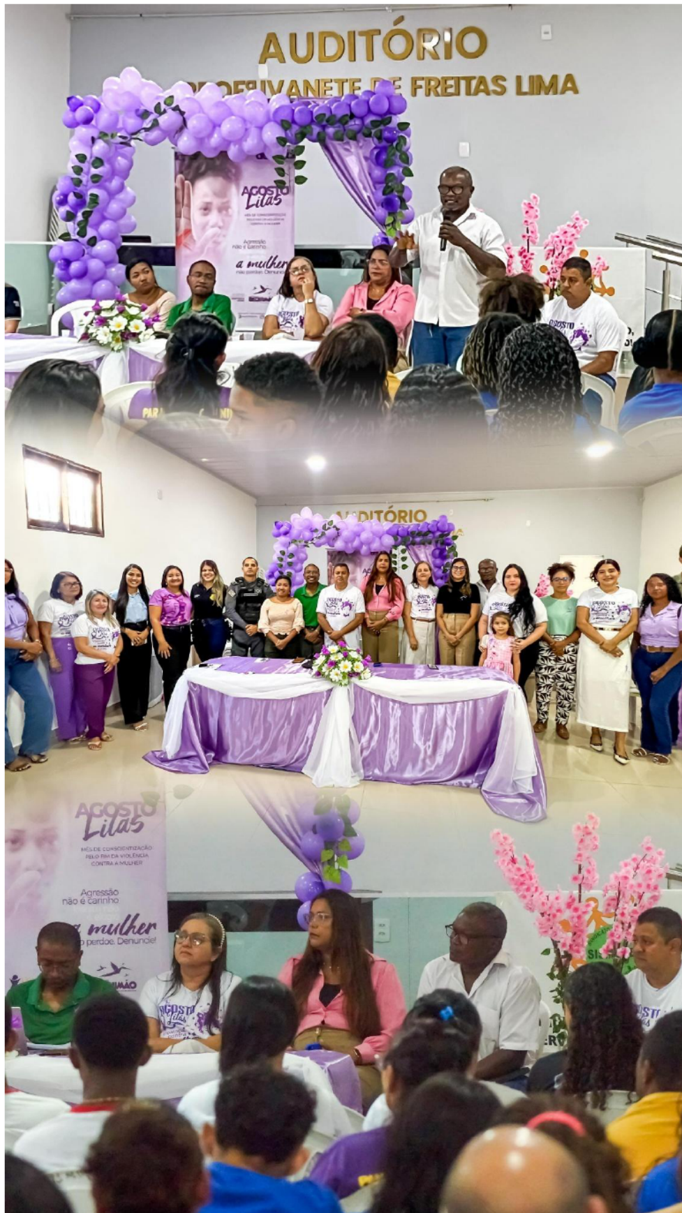
CREAS - CAMPANHA AGOSTO LILÁS