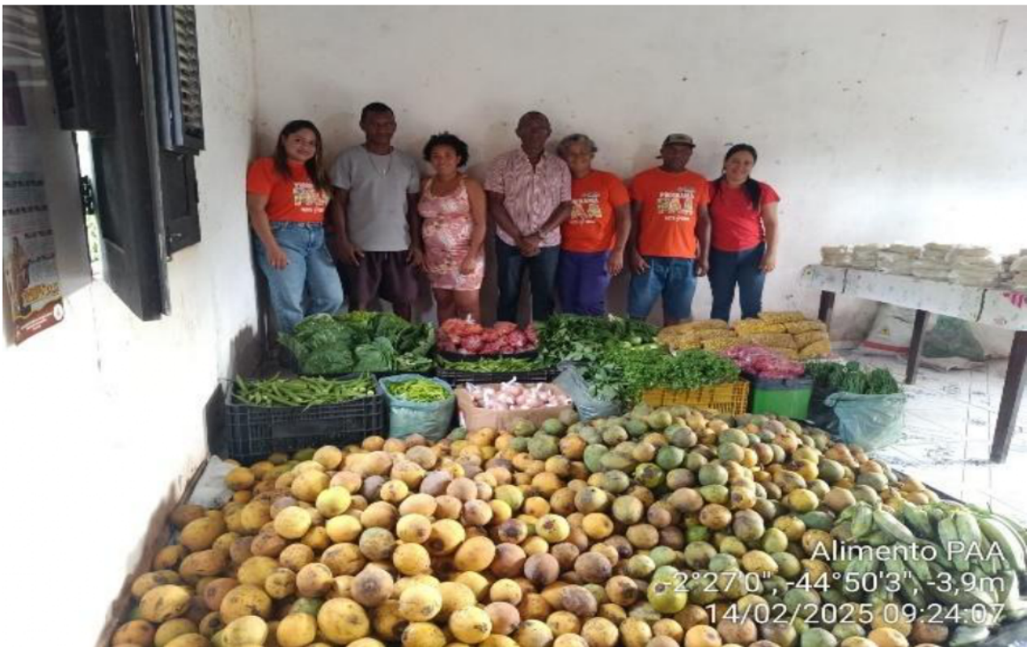
DISTRIBUIÇÃO DE ALIMENTOS ATRAVES DO PAA