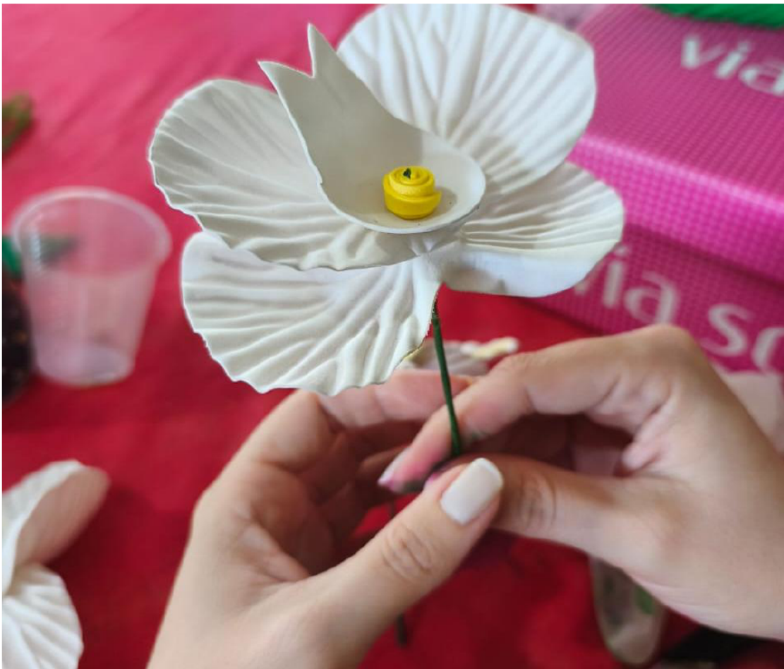
CURSO DE FLORES ARTESANAIS