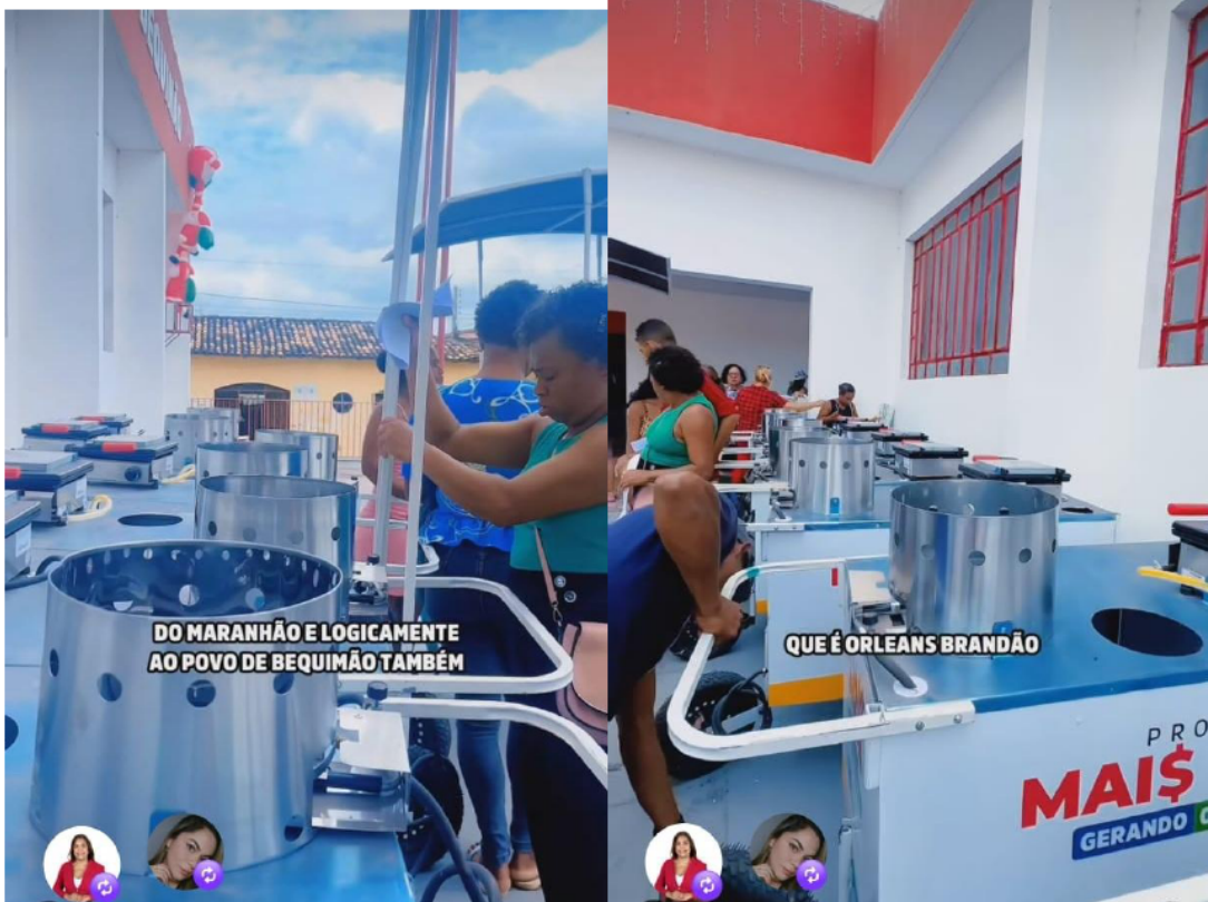
ENTREGA DOS EQUIPAMENTOS DO PROGRAMA MAIS RENDA