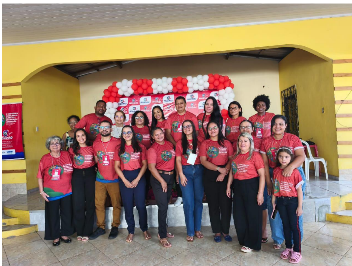
CONFERÊNCIA MUNICIPAL DE SEGURANÇA ALIMENTAR E NUTRICIONAL