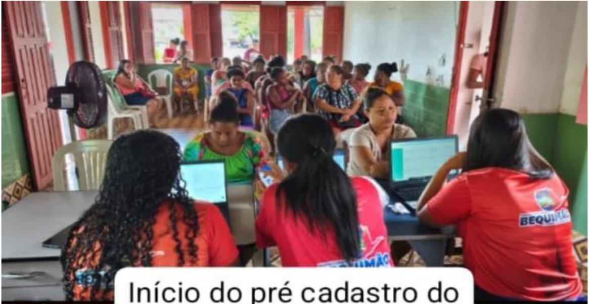
Início do pré cadastro do Maranhão Livre da Fome Prefeitura Bequimão